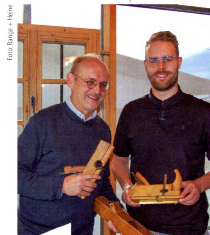
Altholzfenster und Schreinermuseum: Sich zu den eigenen Wurzeln zu bekennen – hier, im Schreinermuseum, steht die Werkzeugkiste der Urahnen aus dem 19. Jahrhundert – ist beim Betrieb in Fridolfing nie Marketing. Sondern im Sortiment konsequent umgesetzt.