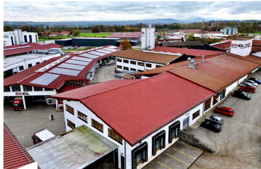
Das Firmengelände in Fridolfing kann mit Fug und Recht als Areal bezeichnet werden.